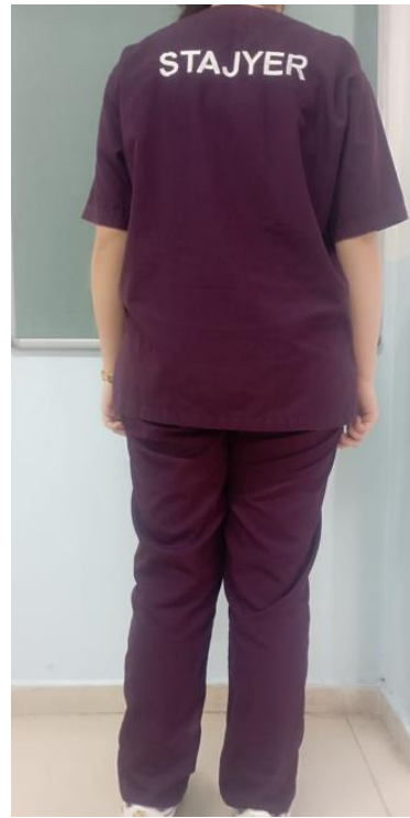
12. Sınıf öğrencilerimizin hastanelerde staj yaparken giymesi gereken forma