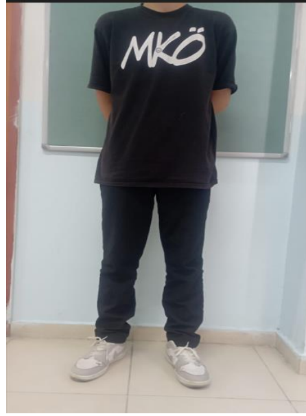
9, 10 ve 11. Sınıfta öğrencilerimizin okul formaları